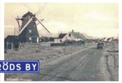
Vykort. Fotograf är troligen Arthur Rube, omkring 1930.