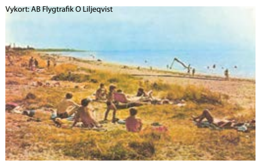
Vykort: AB Flygtrafik O Liljeqvist