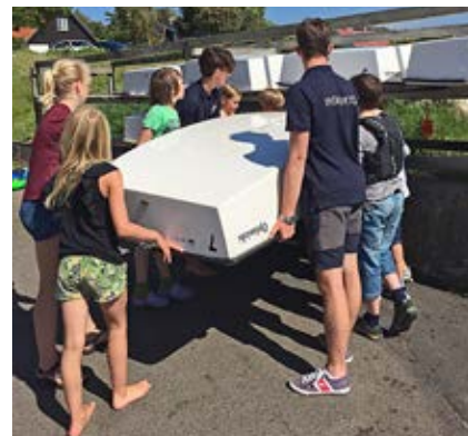
Elever och instruktörer hjälps åt att ställa tillbaka optimistjollen efter tvättning.