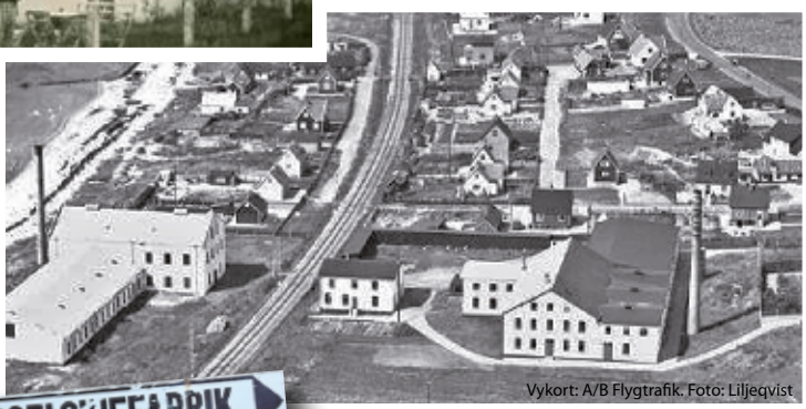
Vykort: A/B Flygtrafik. Foto: Liljeqvist