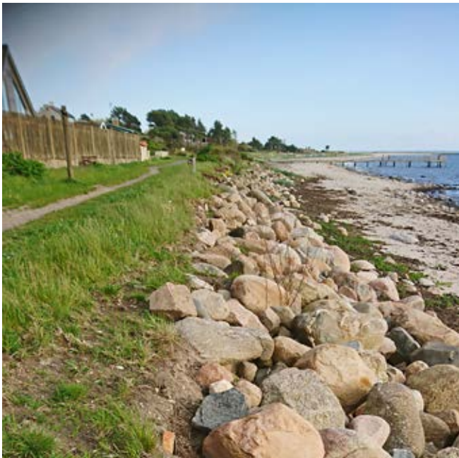
En av de kuststräckor där kommunen skall utreda erosionsskydd är Stelegången.

Byföreningens påverkansarbete och dialog med Höganäs kommun har ”burit frukt” och kuststräckorna norr och söder om hamnen i Nyhamnsläge prioriteras. Beslut fattades vid kommunstyrelsens sammanträde 2018-04-03.