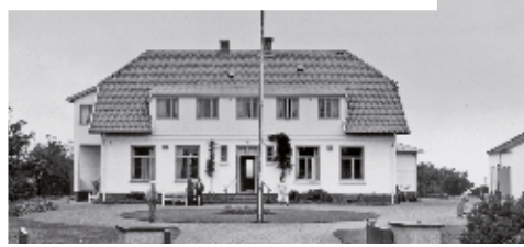
Margreteberg 29 augusti 1949.