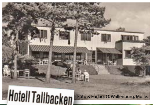
Hotell Tallbacken STRANDBADEN. DANS midsommaraften kl. 8-1 p.n. Bordbeställning tel. 138 Höganäs